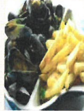
Plats du jour